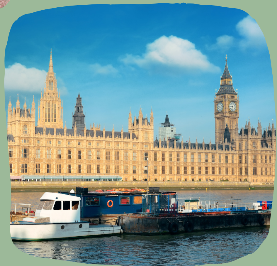
Rejs po Tamizie